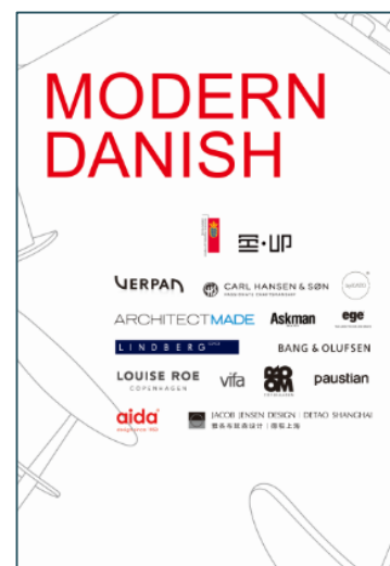
Deltagere i marts 2015 på "Modern Danish"